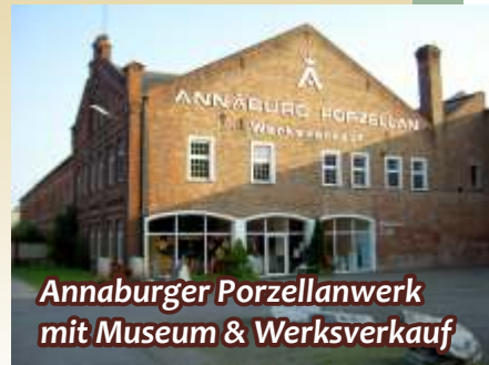
Annaburger Porzellanwerk mit Museum & Werksverkauf