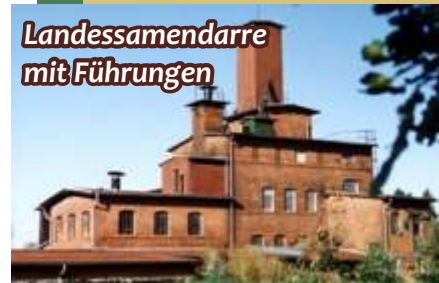
Landessamendarre mit Führungen