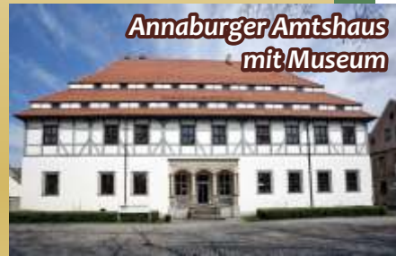
Annaburger Amtshaus mit Museum